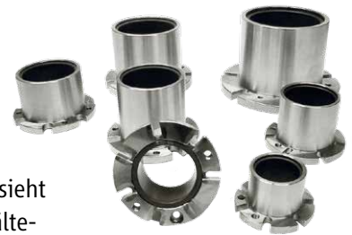
CAMh Gleitlager: Optimale Materialkombination für CO 2